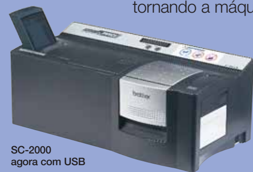
SC-2000 agora com USB

Se é um revendedor de carimbos, loja de cópia, papelaria ou fornecedor de economato, ou está apenas a começar o seu próprio negócio, temos uma máquina que vai realmente marcar a diferença. A Brother Stampcreator PRO™ cria carimbos pré-tintados rapidamente, tornando a máquina numa fonte de rendimento.