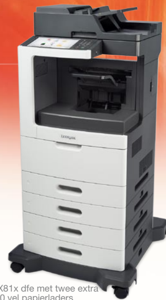
MX81x dfe met twee extra 550 vel papierladers